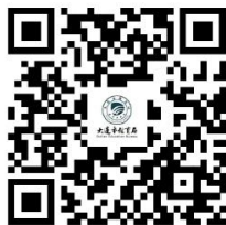
16.往届中考成绩查询